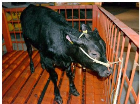
コンテナですくい上げられた子牛。20日午後6時50分ごろ、宮古島市の平良港